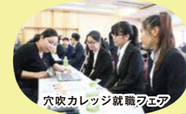
穴吹カレッジ就職フェア

日本語学科卒業後の進学や就職のサポートをします。進学先学校の紹介、入学願書の記入や面接の指導、就職フェアの開催など、皆さんの希望の進路に合わせてサポートします。