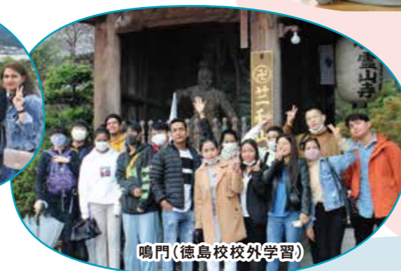
鳴門(徳島校校外学習)