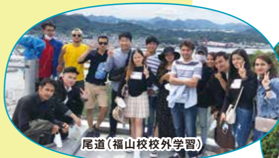
尾道(福山校校外学習)