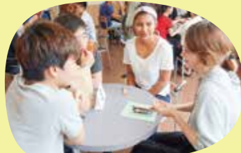
ロシア短期研修生交流授業