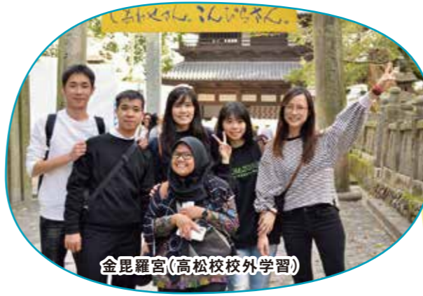
金毘羅宮(高松校校外学習)